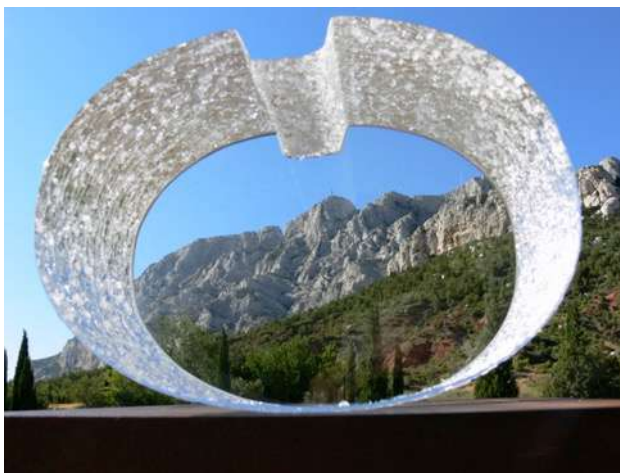
Chaque Grand Site de France reçoit une sculpture "Ecouter le monde", créée par Bernard Dejonghe, à l'initiative du Réseau des Grands Sites de France. Cette œuvre symbolise les valeurs du label Grand Site de France.

Le Réseau rassemble des sites détenteurs du label et d'autres qui se font pour objectif de l'obtenir. En adhérant au Réseau, chaque membre s'engage à tout mettre en œuvre pour obtenir le label Grand Site de France, reconnaissance d'une gestion conforme aux principes du développement durable.