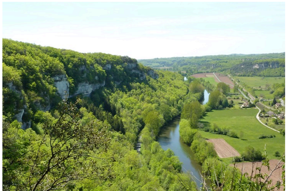
Vallée de la Vézère