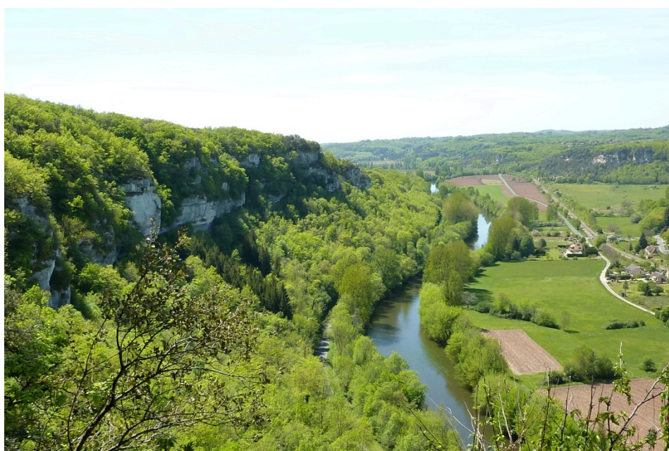
Le Grand Site de la Vallée de la Vézère

Grand Site Vallée de la Vézère (Dordogne) 1 er au 2 octobre 2015