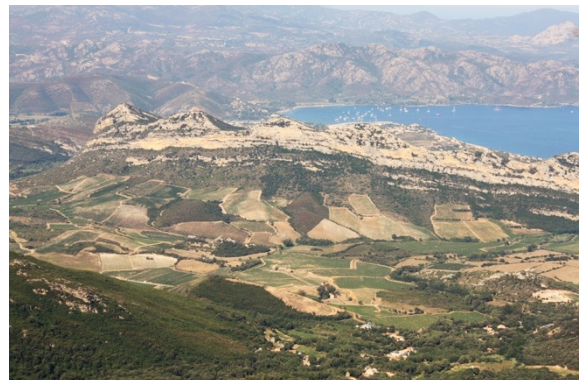
Vignoble de Patrimonio

La pointe de la Parata et les Îles Sanguinaires, classés au titre de la loi du 2 mai 1930 sur la protection des sites, forment une guirlande rocheuse à l'extrémité nord du golfe d'Ajaccio. Le paysage littoral du Grand Site, adossé à la montagne, est souligné par des tours, phares, sémaphores construits entre le XVIII e et XIX e siècle, rappelant que le site a longtemps contrôlé l'entrée de la baie d'Ajaccio.