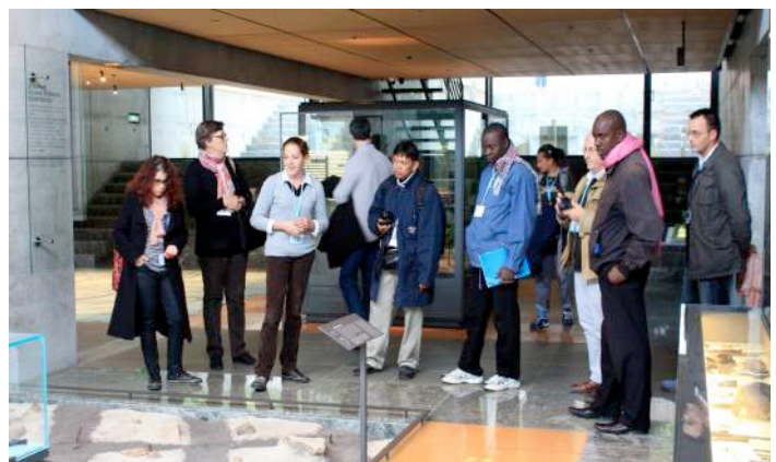
Visite du musée de Bibracte lors de la formation 2013

Les échanges se feront dans le cadre d'ateliers thématiques sur la gestion intégrée d'un site patrimonial : "Habitants et patrimoine", "Patrimoine et développement durable local",... Les intervenants approfondiront alors aux côtés des participants à la formation, ce que signifie concevoir un projet durable et concerté pour la préservation et la valorisation d'un site.