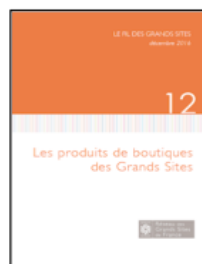
Le Fil des Grands Sites