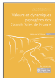
Actes des Rencontres du RGSF