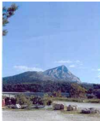
Après : restauration du paysage