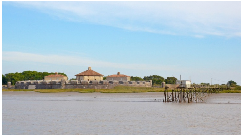
Estuaire de la Charente, Arsenal de Rochefort