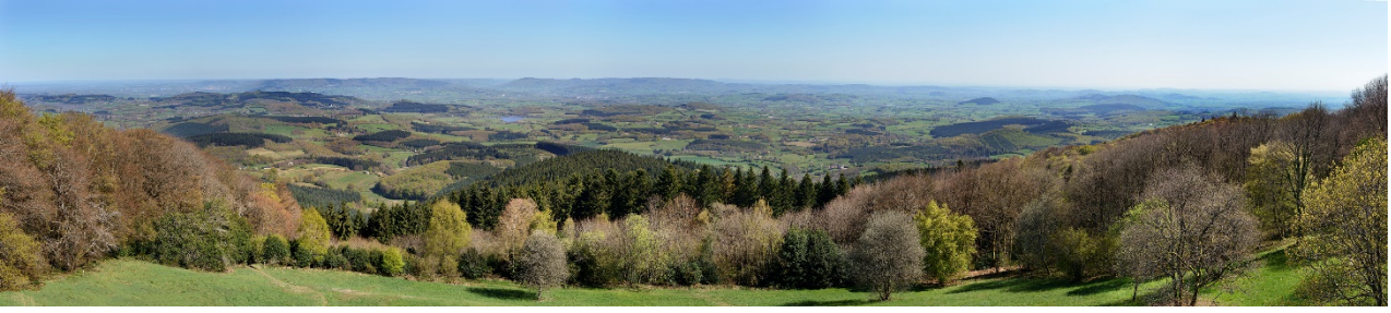
Point de vue depuis le sommet du mont Beuvray, qui est un belvédère exceptionnel sur les paysages agricoles et forestiers du Morvan / cliché Bibracte, Antoine Maillier, n°99437