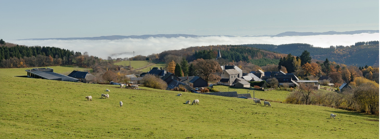
Glux-en-Glenne (Nièvre), plus haut village du Morvan, au cœur du territoire du Grand Site de France / cliché Bibracte, Antoine Maillier, n° 78831