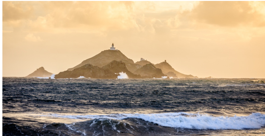
Paysage de tempête, Grand Site de France Îles Sanguinaires – pointe de la Parata

Grand Site de France Îles Sanguinaires – pointe de la Parata (Corse) - 13 et 14 octobre 2022