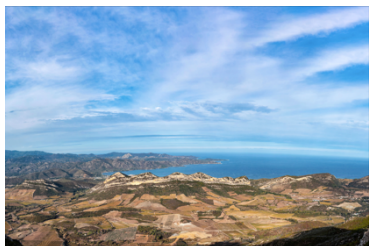
Conca d'Oru, vignoble de patrimoine golfe de Saint Florent