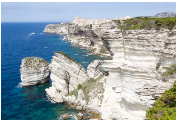
Bonifacio © Bonnenfant