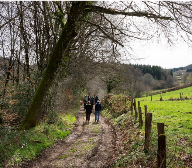
Atelier pratique de repérage sur le réseau exceptionnellement dense de chemins ruraux qui, avec une longueur cumulée de 1.100 km sur les douze communes du territoire du Grand Site de France, contribuent notablement à sa valeur patrimoniale